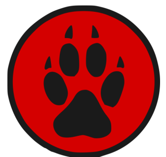
Plakietka Gromady Tropu Wilka